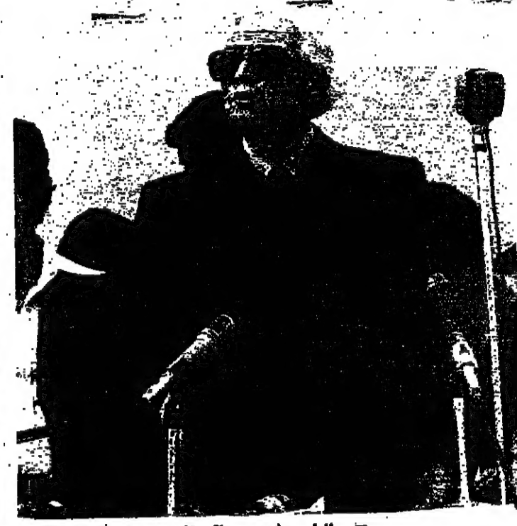
الرئيس شمعون يلقى كلمته في المهرجان

تم تكلم السيد ابراهيم ربابي ، وقد ناقش كلمة سائل المن الجنوبي ، وقد جاء فيها : ايها الزمان ، بدأت معارك حرب الستين وكنا لتغيير الدفاع عن كرامة والذات عن حق يحضر . . . ولا عجز الاخرون عن الحسم لاختيار الساحات لنا . ولم نرض على انفسنا استجداء السلاح ولم نستعج على ابواب العلي ، ولم نتهاك استرضاء لزيد او محمد بن علي اعدائنا من القاروقين والي ديارنا اورا يلتسون نعمة اللقاء والتصالي ، وبها نبيح التجنح ورد متبصر الصوت . تبقى للوطنين الاحرار تلك الهالة من التقسية والعمقة تصب نخلها شهدانا على صورة وطن حدوده خلف الشمس وخلف كل زبد اسمر يطاول الكراكب ويشق مجدا فوق مجد . اميل بعد . ان يني حزب الوطنين الاحرار مضفة في الاواء والتشاد ايام السلم بعد ان كان الركن الاسدي اليه تسند الاقلام ؟ وقال : تقوا ايها الاخوان اننا الحرب على كل ظلمين الثورة على كل ظلمين اللص في كل زمان نحن انصار لكل الاض ولا نرحم الايسر ونحن الجحافل تحرف الى النصر . نحن التاريخ كيناهه بدم وما يكتب بقلم لا نعود فطرات الخسر . . . عهدا علينا ايها الزمان تقطعه بيماركة رئيسنا الحاضر في طهرانيا : ان لا مسلوبه على حساب لبنان ، ولا هروا امام اعداء لبنان ، عهدا علينا الوفاء لارواح شهداء لنا غصوا بالتاريخ المعاصر ملحمة يناعوا الحياة بياض الايمان يشرون لنا بما لنا للحياة . ايها الزمان الاضلال ، كم من هذا الجبل الضخام على التجموع كل حب وكل حرمان بالجبل . واشار ، الى النظام اللبناني ، وعلى المعاهدات الدولية ، وشدد على ضرورة الوحدة ، وقال ان الوفاق لا يمكن ان يكون بين الجماعات ، بل الوفاق هو الوفاق بين اللبنانيين على ضرورة الولاة اللبناني دون سواء .